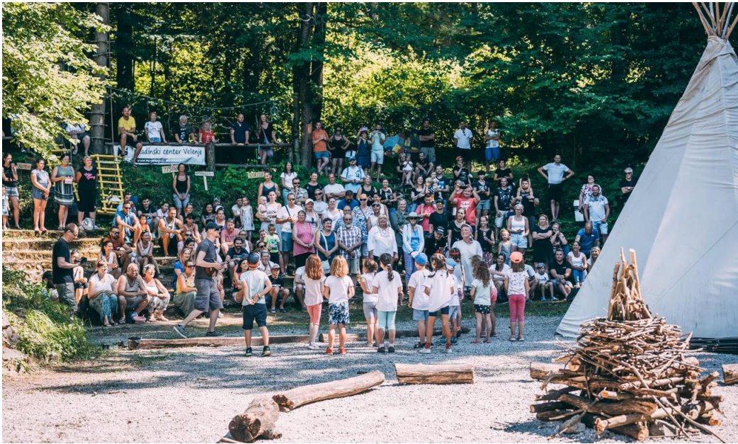
Slika 10: Indicamp

Udarniki so prostovoljska skupina, ki deluje na območju MO Velenje in nudi brezplačno pomoč na raznih področjih. Pomoč nudijo tistim, ki si zaradi slabšega socialnega stanja ne morejo privoščiti dodatne pomoči, starejšim osebam in tistim, ki zaradi zdravstvenih omejitev dela ne zmorejo opraviti sami, nimajo pa finančnih sredstev za plačilo tovrstnih storitev. Na pomoč priskočijo tudi raznim organizacijam, zavodom in društvom, ki delujejo v korist lokalne skupnosti.