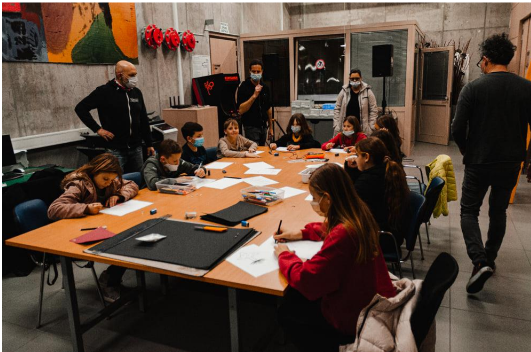
Slika 17: konS delavnica

Kons vizija se prepleta skozi tri glavne smernice: konS Park , konS Nova , konS Praksa .