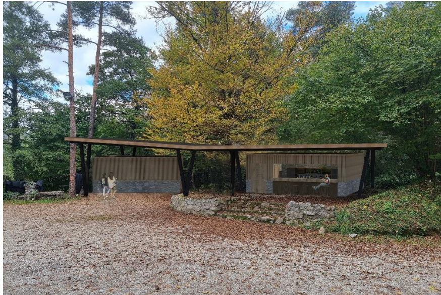
Slika 3: Vizualizacija nove zgradbe na Letnem kinu