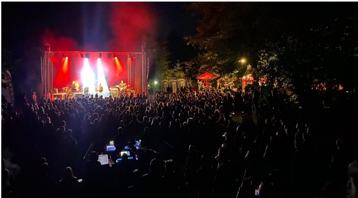
Slika 1: Letni kino, Lakefest

Letni kino ob Škalskem jezeru je prireditveni prostor, ki so ga mladi ob pomoči Mladinskega centra Velenje, Šaleškega študentskega kluba, Mestne občine Velenje in Mladinskega sveta Velenje, leta 2010 ponovno obudili. Prostor je bil zaradi neuporabe zaraščen z gozdom, ki so ga mladi očistili, prostor je z leti in s pomočjo več deležnikov pridobil sedanji izgled. Zaradi umaknjene lege, ograjenosti in samega sonaravnega izgleda, je idealen koncertno - prireditveni prostor. Iz velikega platoja preko amfiteatričnih stopnic se dviguje v gozd in ima več koticov in platojev, primernih za manjše dogodke (delavnice). Prostor velikosti cca 1200 m 2 je ograjen z gradbeno ograjo in ima dva vhoda. Na prostoru je priključek za vodo (zasilen), manjši lesen objekt (zasilno skladišče, izvedba manjšega gostinstva), prostor ima zasilno razsvetljavo in solidno elektro omarico. Za potrebe prireditev sta na prostoru postavljeni dve šotorski kupoli (10m X 10m), ki služita kot streha za nastopajoče v zaodrju in kot streha za gostinsko dejavnost na večjih prireditvah, kot tudi za različne dogodke.