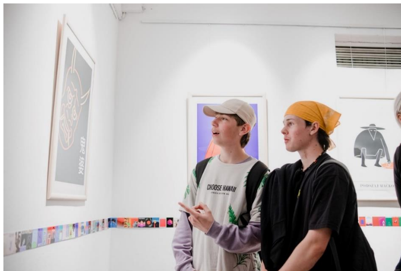
Slika 14: Razstava v Mladinskem kulturnem klubu eMČe plac

Klub eMČe plac je že vrsto let priljubljeno zbirališče mladih. Mladi soustvarjajo tako zunanjo podobo kot programsko shemo, ki jo polnijo z vsebinami, ki jih zanimajo. Je alternativni klub, kjer nastajajo vedno nove kulture in sveže ideje in prostor, kjer sobivajo različne subkulture.