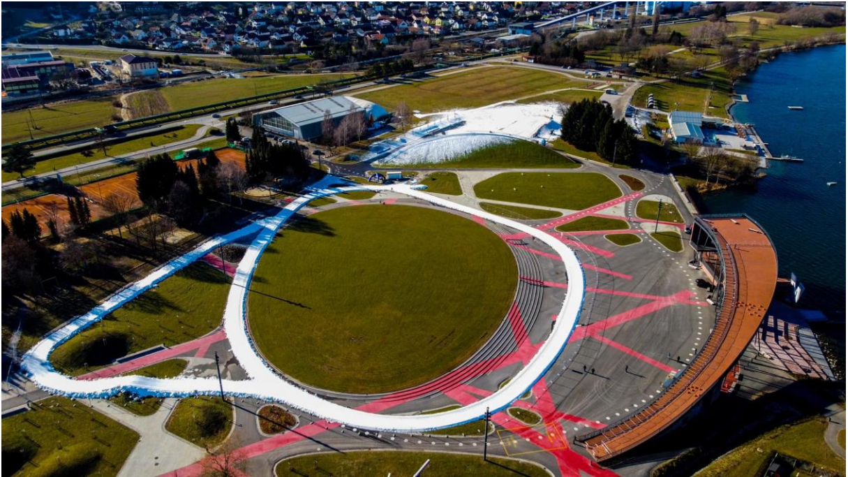
Slika 7: Vista – park z razgledom