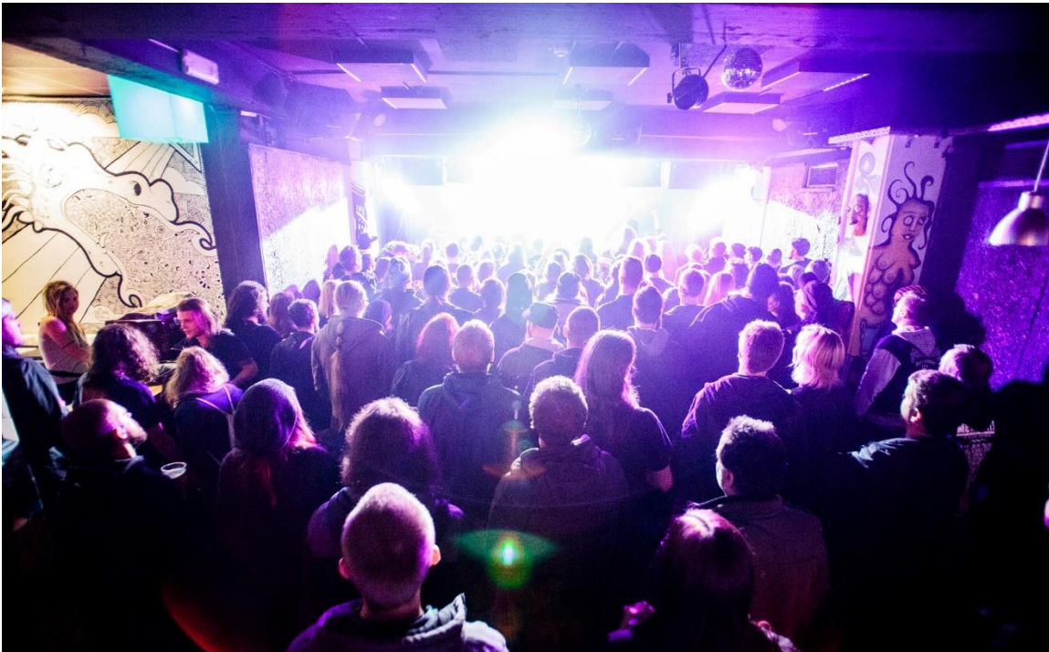
Slika 15: Koncert v Mladinskem kulturnem klubu eMCe plac