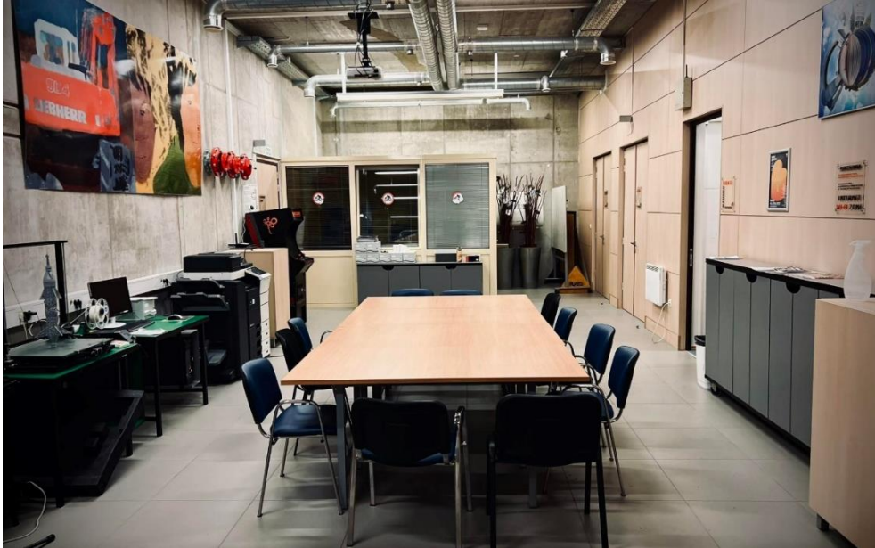
Slika 6: MMC Kunigunda

Trudili se bomo za kvalitetno sodelovanje z Mestno občino Velenje, javnimi zavodi in mladinskimi društvi.