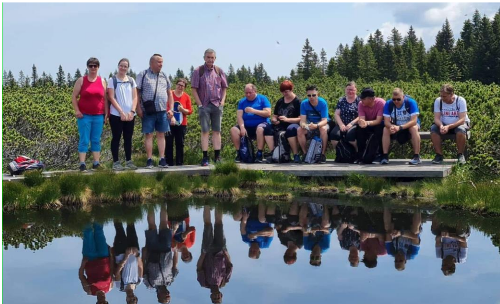
Slika 13: Moj klub, Lovrenška jezera

V Mladinskem centru Velenje deluje tudi dnevni center za osebe s težavami v duševnem zdravju, Moj klub. Dnevni center ponuja varen, zaupen prostor, kjer lahko obiskovalci z nekom spijejo kavo, se pogovorijo, spoznajo nove ljudi in na ta način razširijo svojo socialno mrežo. Prostor, kjer se lahko odprejo, spregovorijo tudi o svojih težavah brez, da bi jih kdo obsojal. Posledično se na ta način izboljša počutje in duševna stiska ni tako velika ali pa se posameznik z njo lažje spoprime in jo premaga. Ob tem se poveča občutek lastne vrednosti, koristnosti in veljave. Če posameznik sam ne zmore oziroma potrebuje pomoč, smo v podporo pri vključevanju v okolje in spremljevalci pri vzpostavitvi stika z institucijami kot so center za Socialno delo, zdravstvene službe, itn.