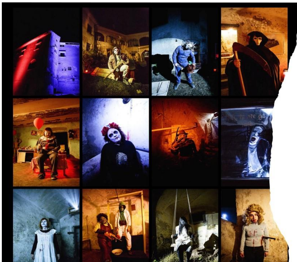
Slika 18: Hiša groze 2018

Obiskovalcem je omogočil, da doživijo strašljive sobe z znanimi grozljivimi liki. Na prilagojenih grozljivih hodnikih z efekti in glasbo so se tako lahko srečali z več kot 15 različnimi dodelanimi liki: Jason, Emily, Micheal, Pennywise, Freddy in drugimi. Vsako leto se je širil in razvijal. Hiša groze se je do leta 2019 razvila tako po kvaliteti, strukturi, številu ekipe in zainteresirane publike, saj je projekt bil zelo dobro sprejet s strani obiskovalcev. Zadnjih nekaj let je bila Hiša groze razprodana.