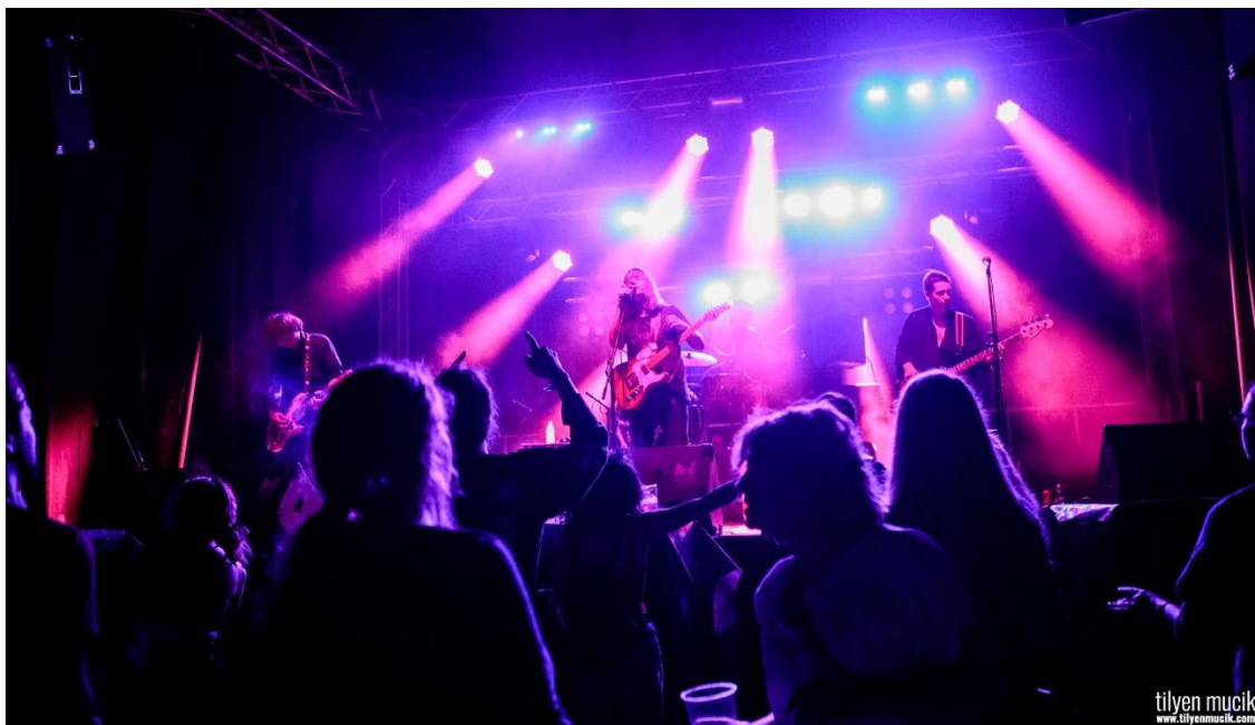
Slika 16: Festival mladih kultur Kunigunda

Festival, ki ga lokalni mladi v njenem imenu organiziramo že od leta 1998, pa ni nič kaj strašen. Po krivem obdolženi mladenki se želimo pokloniti z mlado kulturo, ki je velikokrat prav tako po krivem obtožena, da ni dovolj kulturna. Tudi alternativna kultura išče svoj prostor pod soncem, tako kot ga je iskala Kunigunda. Mi je ne obsojamo in ji dajemo možnost, da se razcveti v vsem svojem šarmu, mladostnem zagonu, se razvija in plemeniti, prav tako pa tekom festivala dajemo možnost obiskovalcem, da se z njo spoznajo, spoprijateljijo in v njej uživajo.