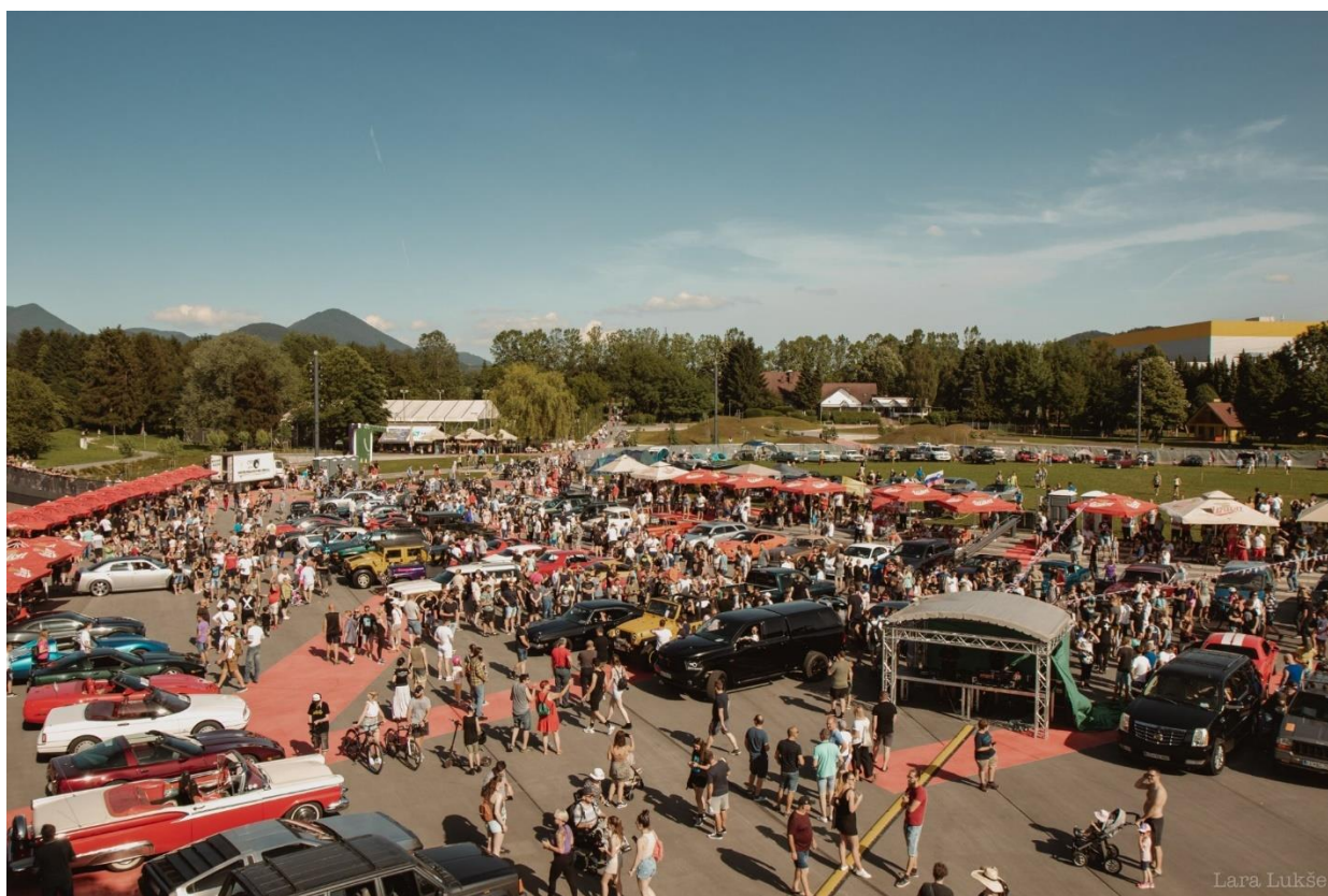
Slika 19: Days of Thunder 2022

V letu 2023 se bo dogodek razširil na dvodnevno dogajanje. Razširila bi se predvsem ponudba hrane. Vključili bi se tudi lokalni ponudniki, ki so na prvem dogodku manjkali. Vsak dan bi se koncerti začeli izvajati že okoli pozno popoldne in zaključili nekje do pol noči.