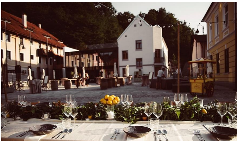
Slika 5: Pekarna idej, Šilifest

Količinsko je stvari v tem trenutku težko opredeliti, vsekakor bodo aktivnosti potekale skozi vso leto.