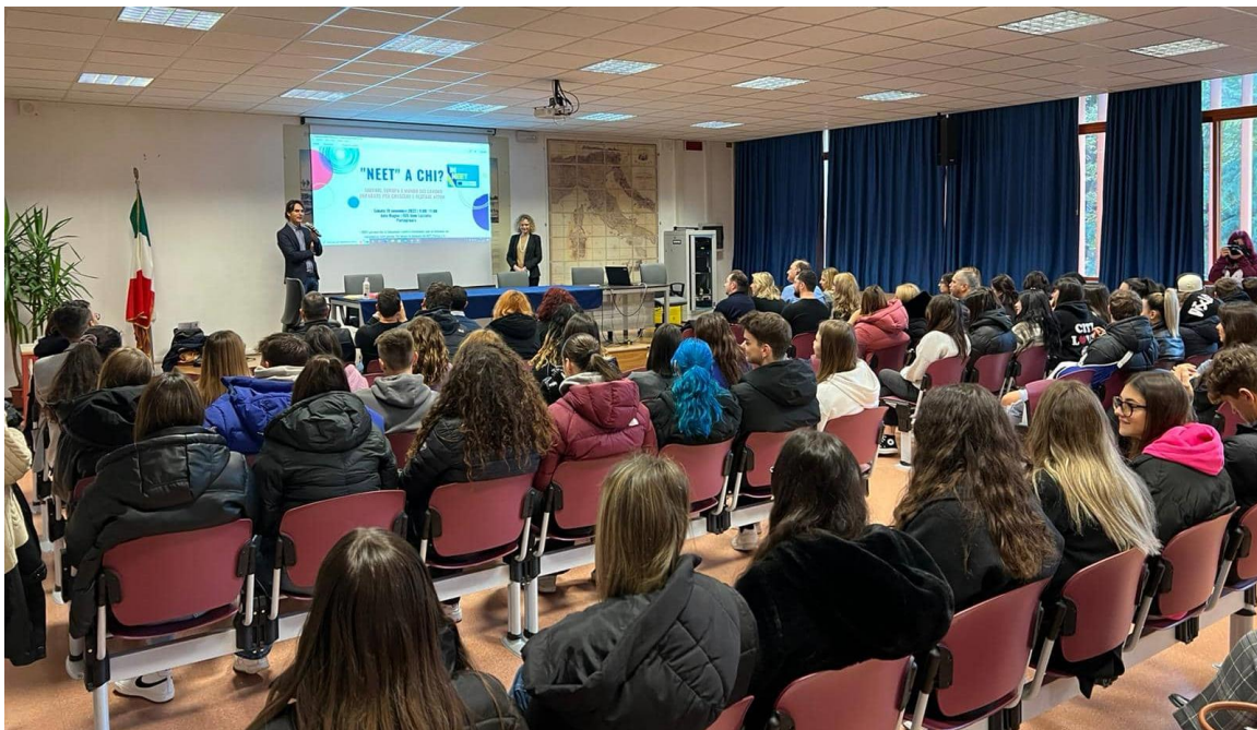
Slika 12: IN NEET Portogruaro, Italija

V naslednjih petih letih želimo obdržati obstoječe programe (ESE, Erasmus+ Mladi v akciji, vključevanje v Evropo za državljane, pobratena mesta, ipd.) in jih nadgraditi z novimi aktivnostmi, organizirati mednarodne obiske mladinskih delavcev, izmenjavo dobrih praks in spoznati še druga neraziskana področja evropskih projektov.