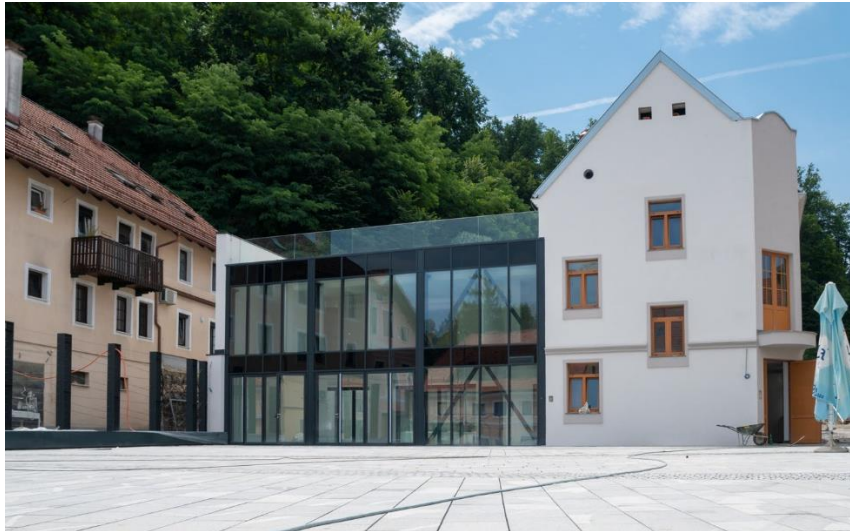
Slika 4: Pekarna idej