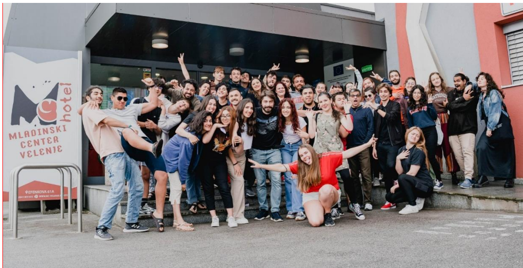
Slika 11: Mladinska izmenjava Green vibes only