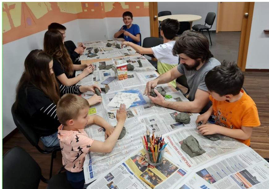
Slika 8: SMO - ustvarjalna delavnica

Središče mladih in otrok, Mladinski center Velenje je namenjeno otrokom, mladostnikom in njihovim staršem, ki si želijo kvalitetno in kreativno preživeti svoj prosti čas. Otrokom in mladostnikom nudimo prostor za druženje, kjer se počutijo varne in sprejete. Spremljamo jih v procesu odraščanja in jim pomagamo pri reševanju dnevnih težav. Dnevni center je odprt od ponedeljka do četrтка od 13:00 do 20:00 ure.